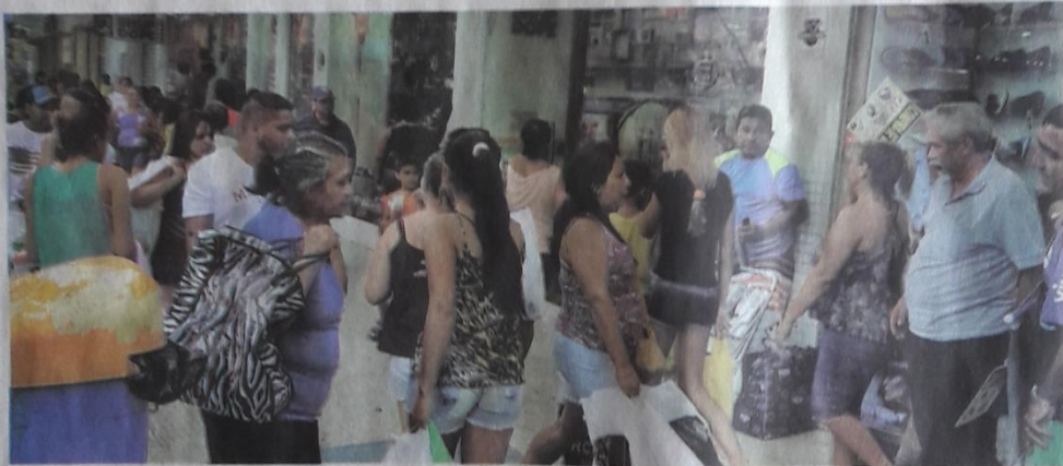
CNC prevê que o Natal deste ano deverá registrar a primeira queda nas vendas desde o ano de 2004 no comércio varejista de todo o país

Previsão pessimista foi feita pela CNC, que estima queda de 4,1% nas vendas deste ano em relação a 2014, retração que freará contratação de temporários