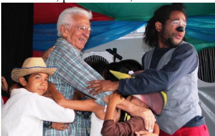
Feira de Livros do Sesc

Literatura em alta com 'dobradinha' de grandes eventos, em Manaus Feiras do Livro de Manaus (Flim) e do Sesc Amazonas acontecem, praticamente, de forma simultânea.