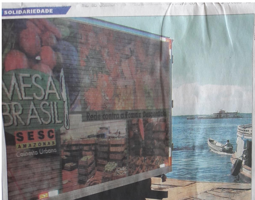
Programa Mesa Brasil, do Sesc, atende cerca de 200 instituições de caridade no Amazonas, sendo 143 delas localizadas na capital