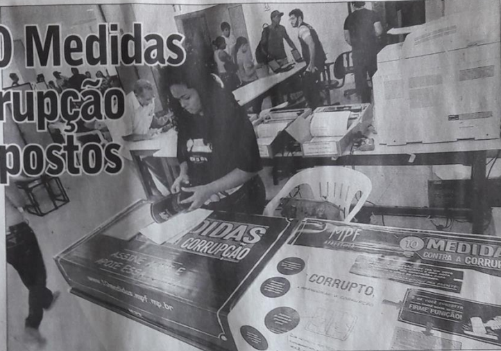
Até a última semana, mais de 2,1 mil assinaturas haviam sido coletadas pelo MPF/AM em todo o Estado do Amazonas

nas, na capital e no interior, nos fóruns de Justiça e nas unidades da Defensoria Pública do Estado de todas as cidades amazonenses. Na capital, também são parceiros na coleta de apoio às 10 medidas a Receita Federal, a CDLM (Câmara de Dirigentes Logistas de Manaus), o Minis-