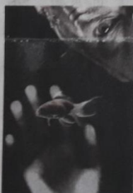
“Aquário” é outro título da seleção