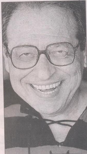
Ruy Castro é um dos mais importantes biógrafos do país

Super Libris mergulha na literatura, unindo entrevistas com 52 escritores e curiosidades que fomentam o mundo da criação de livros (como "onde os escritores escrevem?", a "fagulha que originou a vontade de escrever", "booktubers" e "livros mais comentados"). Com 52 episódios e duração de 26 minutos cada, a série possui um portal na internet com recortes de todos os depoimentos e quadros, uma fonte de pesquisa inédita no Brasil.