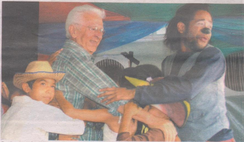
Realizada em Itacoatiara, no ano passado (foto), a Feira de Livros do Sesc Amazonas retorna à capital amazonense para celebrar seus 30 anos

Feiras do Livro de Manaus (Flim) e do Sesc Amazonas acontecem, praticamente, de forma simultânea