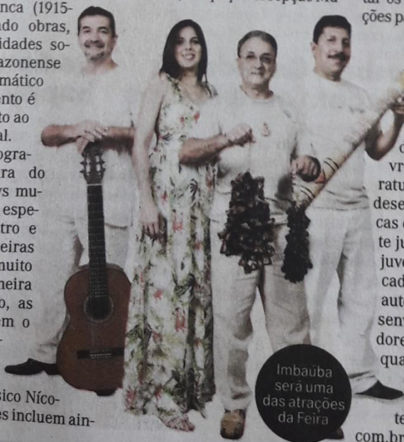
Imbaúba será uma das atrações da Feira

Realizada anualmente pelo Sesc em todo o Brasil, a Feira do Livro busca difundir a literatura no País; estimular o desenvolvimento de práticas de leitura especialmente junto ao público infantil, professores e educadores em geral; divulgar autores; e incentivar o desenvolvimento de ilustradores e obras literárias de qualidade. Mais informações sobre a Feira podem ser obtidas no site http://www.sesc-am.com.br/feiradelivros .