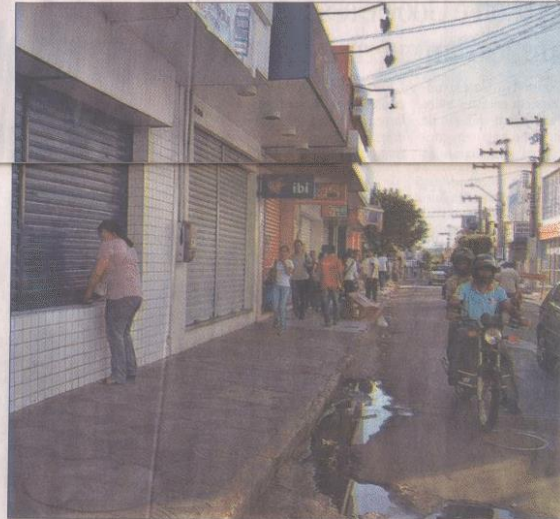
No Brasil, total de estabelecimentos comerciais caiu 5,6% em 12 meses

Calife explica que, no caso da indústria, a situação já vinha piorando há mais tempo,