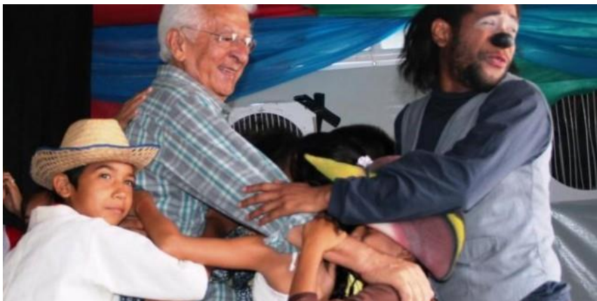
Feira de Livros do Sesc Amazonas retorna à capital amazonenses para celebrar seus 30 anos.