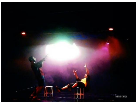
Espectáculo de dança-teatro “Dúplice”

O Les Artistes Café Teatro, Centro, recebe nesta sexta-feira (3), às 20h, o espetáculo de dança-teatro “Dúplice”, pelo “Sesc – Palco Giratório”, de circulação nacional. Dirigida por Rodrigo Cunha e Rodrigo Cruz, a obra aborda uma mensagem sobre luta e duplicidade, trazendo um diálogo entre um ator e um bailarino que estão vendendo uma mercadoria, que seria a arte cênica. Utilizando a linguagem da dança e a do teatro físico.