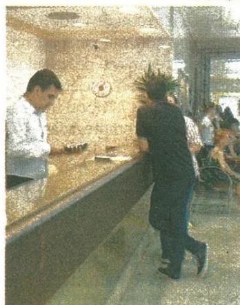
Inscrições podem ser feitas pela internet no site www.sympla.com.br

O aluno formado será capaz de planejar e coordenar as atividades diárias do departamento de governança de um hotel. No curso, será ensinado a estabelecer os fluxos de trabalho e organizando as equipes em relação às tarefas e às escalas de serviço e plantão, respeitando a legislação trabalhista e de segurança do trabalho vigentes e as normas e procedimentos da organização.