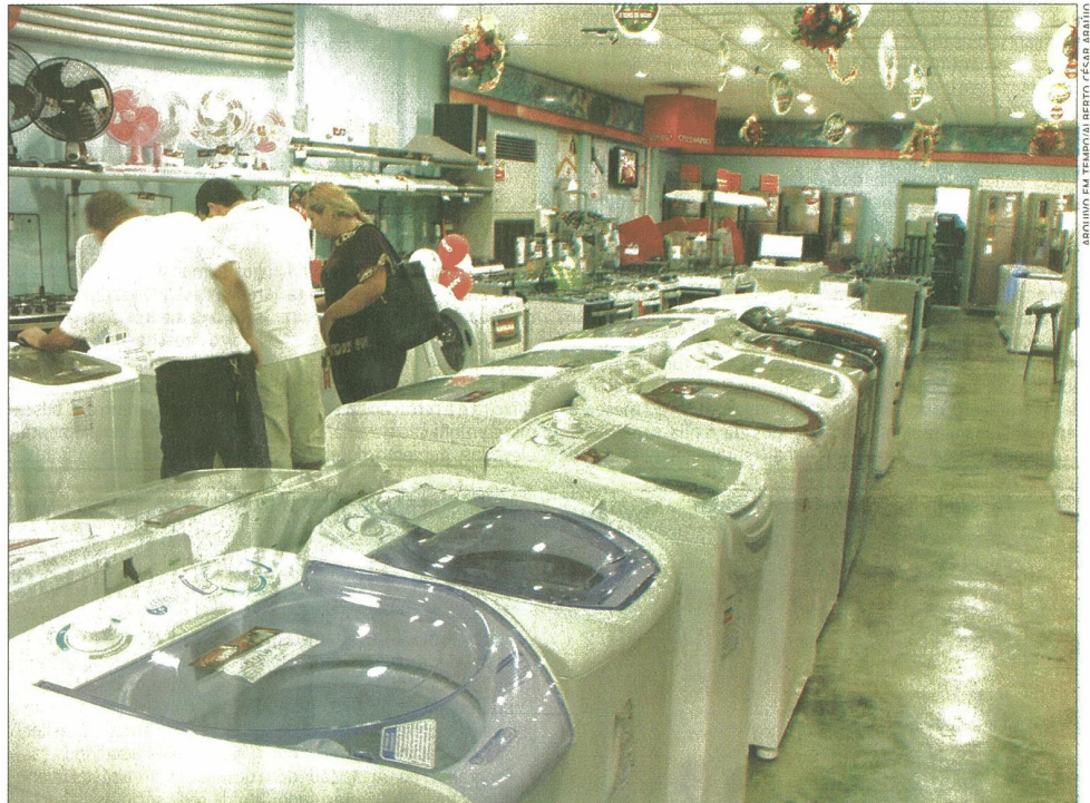
Bens duráveis como máquinas de lavar roupa, geladeiras e freezer serão os presentes menos procurados, por conta do preço das parcelas

O Centro de Estudos do Clube dos Diretores Lojistas do Rio de Janeiro (CDL Rio) espera que as vendas deste ano para o Dia das Mães aumentem 2%, com base em levantamento feito