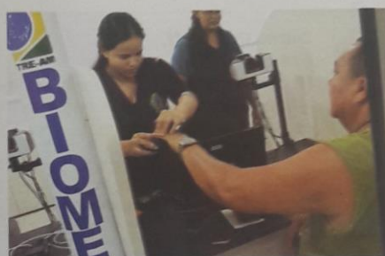
Manaus conta com dez postos de atendimento para o cadastramento biométrico do eleitorado

"Depois da notícia do TSE de que as eleições seriam manuais, a população vinculou as coisas, mas dias depois o TSE garantiu a eleição na urna eletrônica. Mas o eleitor tem de estar atento que o prazo da revisão biométrica é até o dia 26 (de fevereiro). O eleitor tem de estar ciente que não adianta ir no último dia fazer fila no TRE, pois só há atendimento